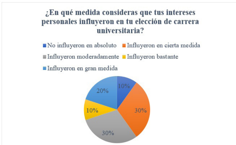
Figura 1. Intereses personales

Para la realización de este objetivo, realizamos una encuesta a 25 estudiantes de múltiples áreas universitarias.