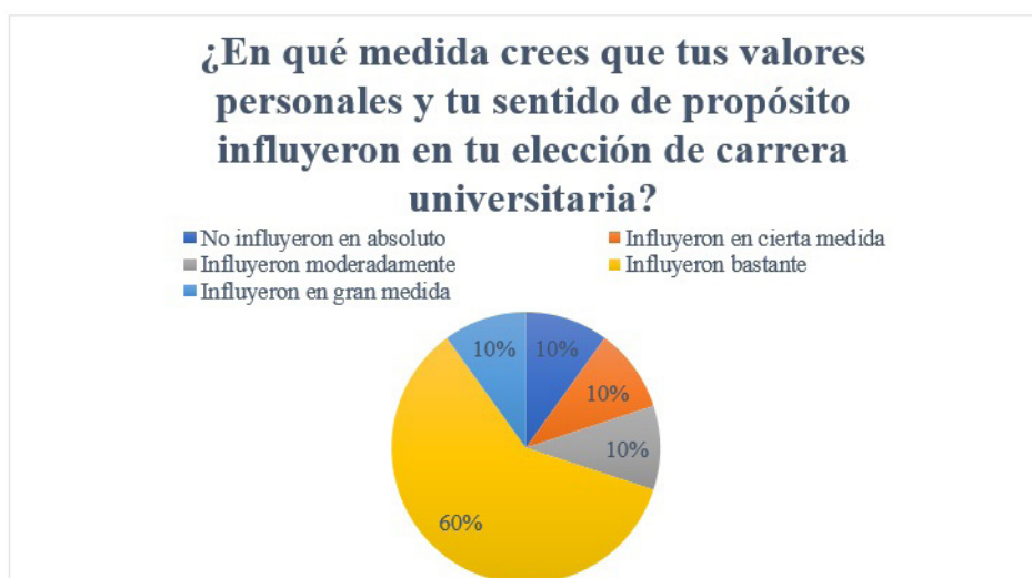
Figura 4. Valores personales

perder esa cultura. Por otro lado, el 30% afirma que el impacto fue moderado, pues piensan que las decisiones deben ser más personales que familiares.